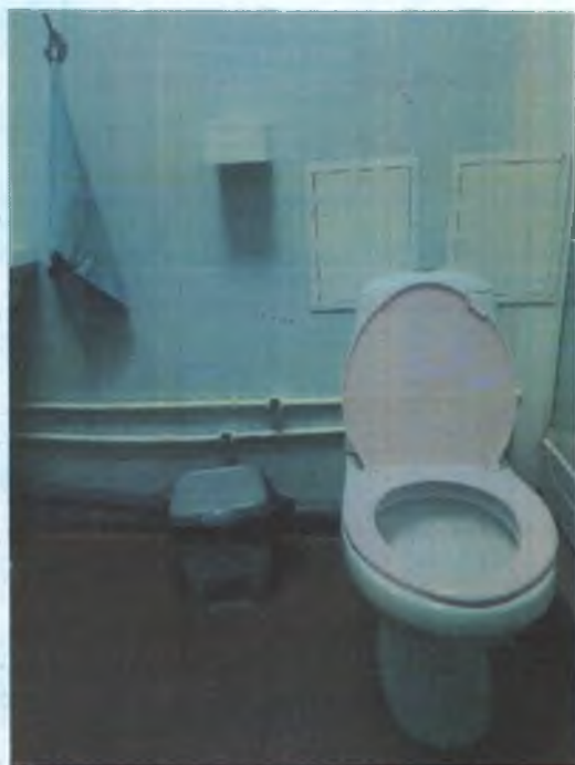
ФОТО № 10 ТУАЛЕТНАЯ КОМНАТА