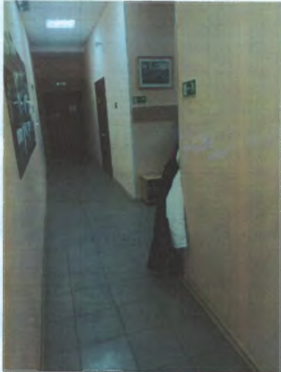
ФОТО №12 КОРИДОР