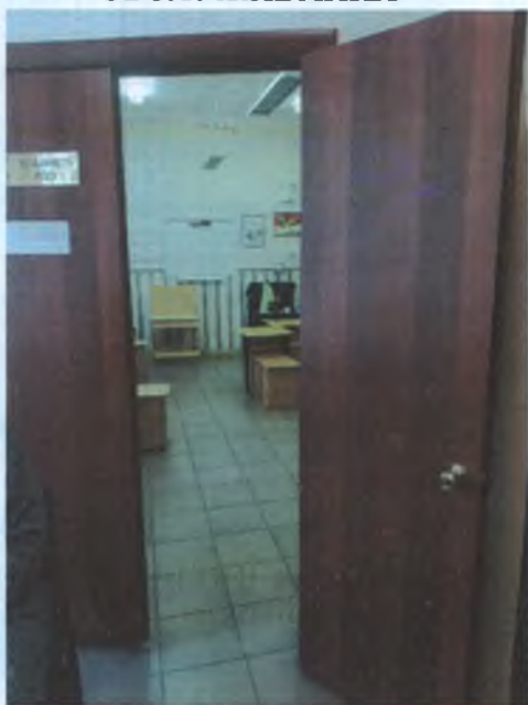
ФОТО № 8 КАБИНЕТНАЯ ФОРМА ОБСЛУЖИВАНИЯ