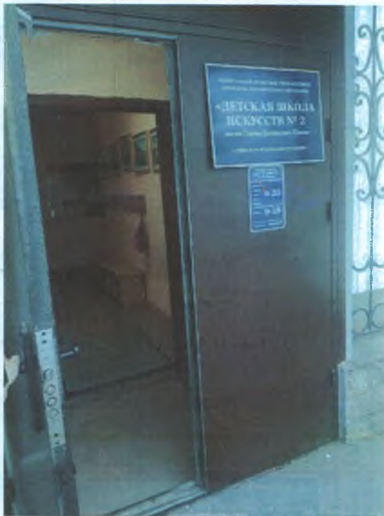
ФОТО № 2 ВХОДНАЯ ЗОНА