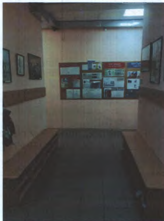
ФОТО № 5 ВХОДНАЯ ЗОНА (ЗОНА ОТДЫХА)