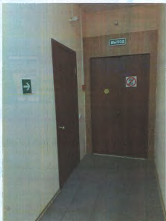
ФОТО № 6 ВЫХОД ЭВАКУАЦИОННЫЙ