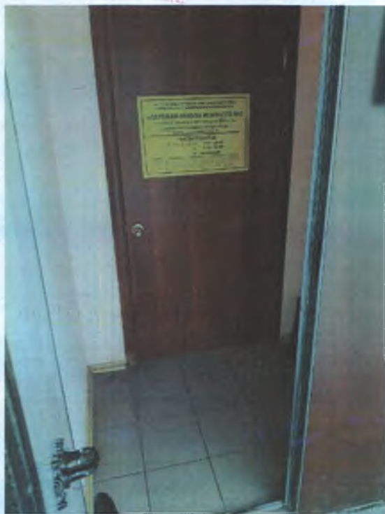
ФОТО № 4 ТАМБУР