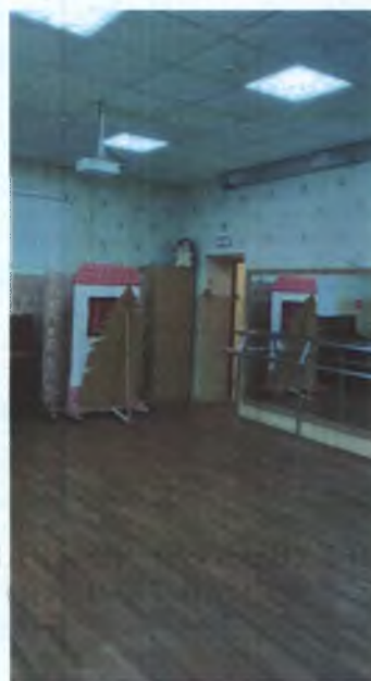
ФОТО № 9 ЗАЛЬНАЯ ФОРМА ОБСЛУЖИВАНИЯ