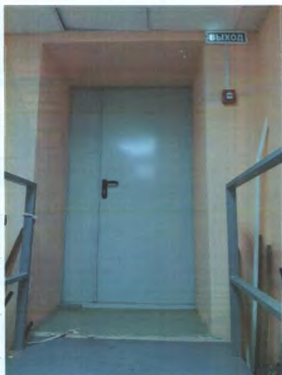
ФОТО № 6 ВЫХОД ЭВАКУАЦИОННЫЙ