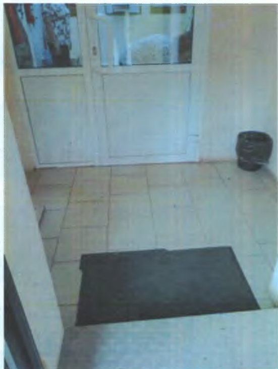
ФОТО № 4 ТАМБУР