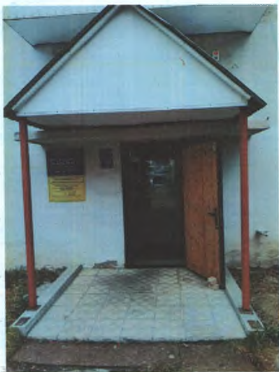
ФОТО № 2 ВХОДНАЯ ЗОНА